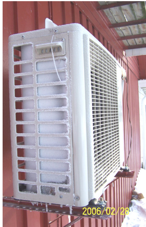
IVT uteluftvärmepump. Påtaglig påfrostning. Utetemp -11,5 °C

Uteluftbaserade värmepumpar har en begränsad funktion. Ju kallare det är ute desto mindre värme kan den plocka ur uteluften (logisk princip). I praktiken visar det sig ofta att trots att utedelen avfrostar regelbundet, så gör isbildningen att utedelen mer eller mindre täpps igen. Luftflödet genom utedelen blir lågt och därmed blir även energiutvinningen låg.